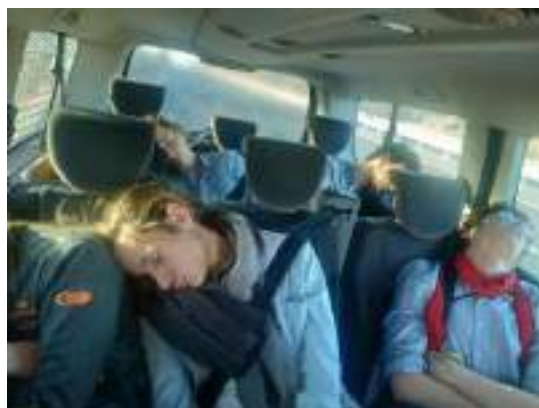
Dans le Jumpy de la MJC, retour des 24H de Paris