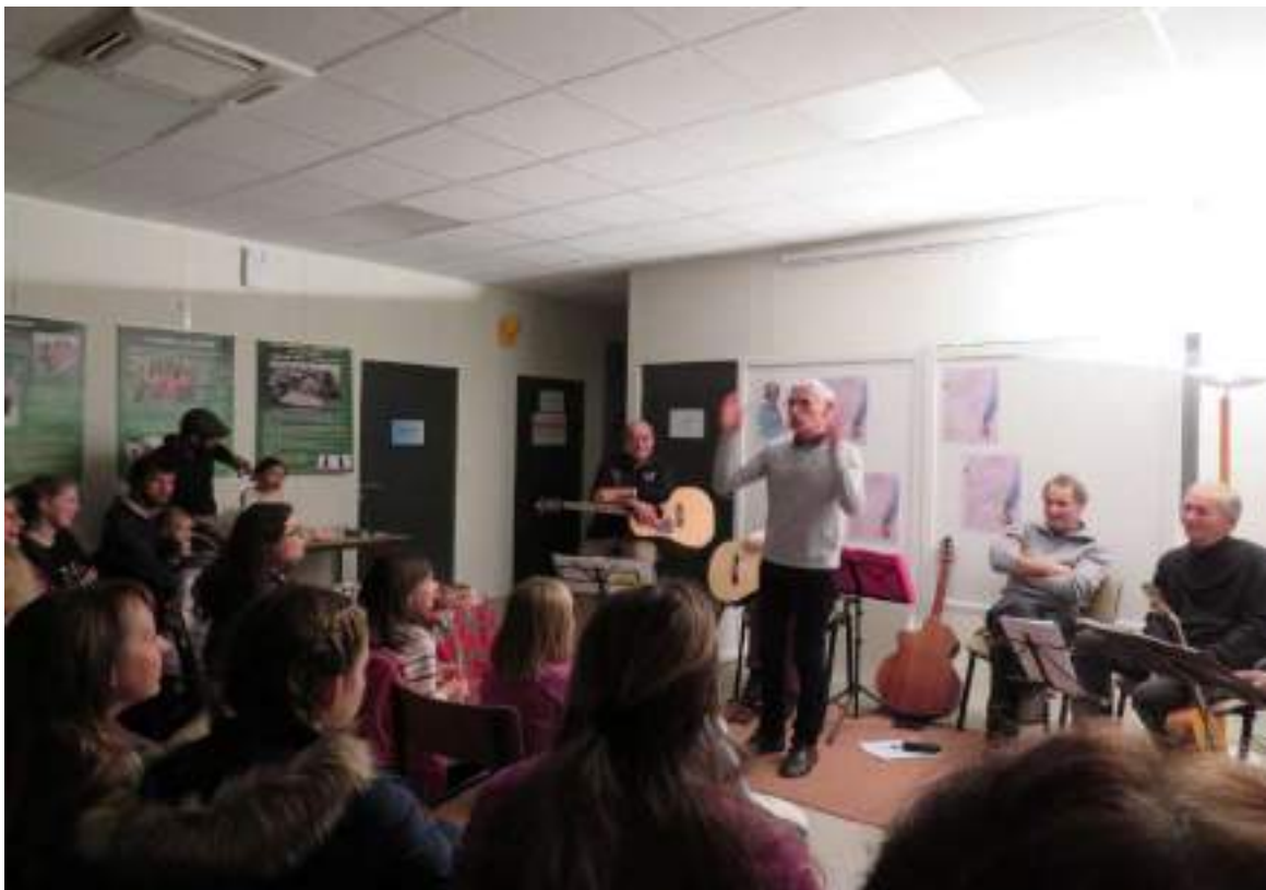
Ca conte à Dole ! S'essayer à raconter en public !