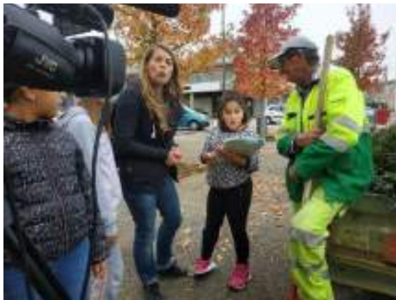
Tournage d'une séquence vidéo sur les Mesnils Pasteur en partenariat avec les Loisirs Pop