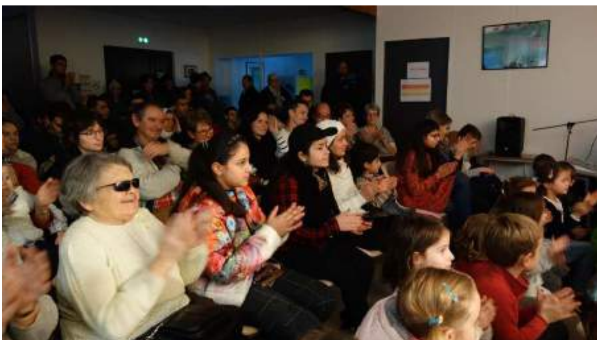
Spectacle de Noël avec l'atelier théâtre du CADA (Centre d'accueil et de demandeurs d'asile) – Animateur Guy Dubled