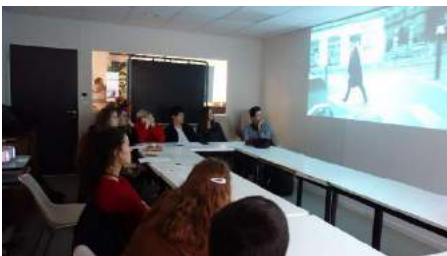
Séance d'analyse de films. Atelier de préparation aux 24H

Enfin, le secteur éducation à l'image contribue à la mise en valeur de la MJC à travers la mise en œuvre d'outils de communication externes :