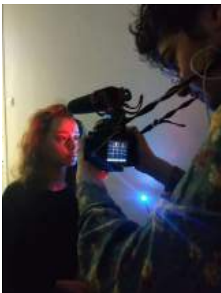
Tournage aux 24H de Dole 2019