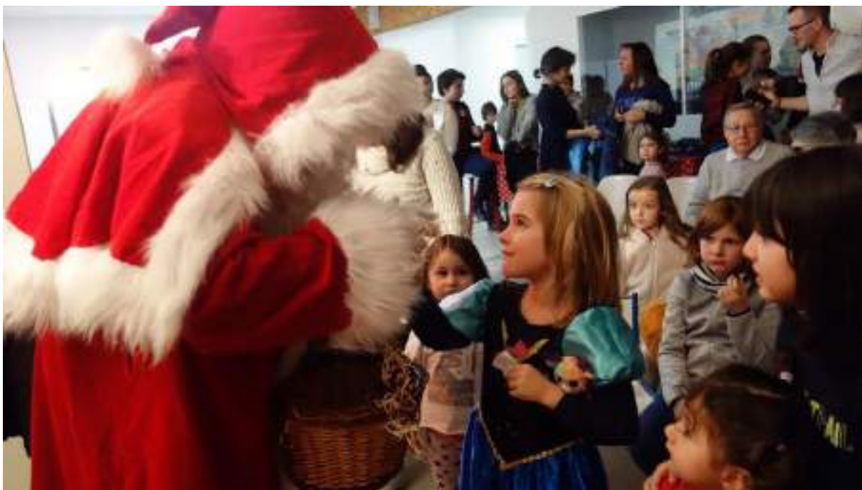
C'est à qui le tour de faire le père Noël cette année ?