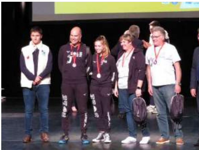
Trophés des Sports de la Ville de Dole : la dynastie Lanoy à l'honneur pour son engagement sur 3 générations.

La Ville de Dole met à disposition les salles et les installations sportives comme pour toutes les associations sportives de DOLE. Avec les travaux de la Ville sur le complexe sportif, le club est encore implanté au gymnase du Lycée Duhamel. Le club volley de la MJC est le seul club dolois de Volley-Ball.